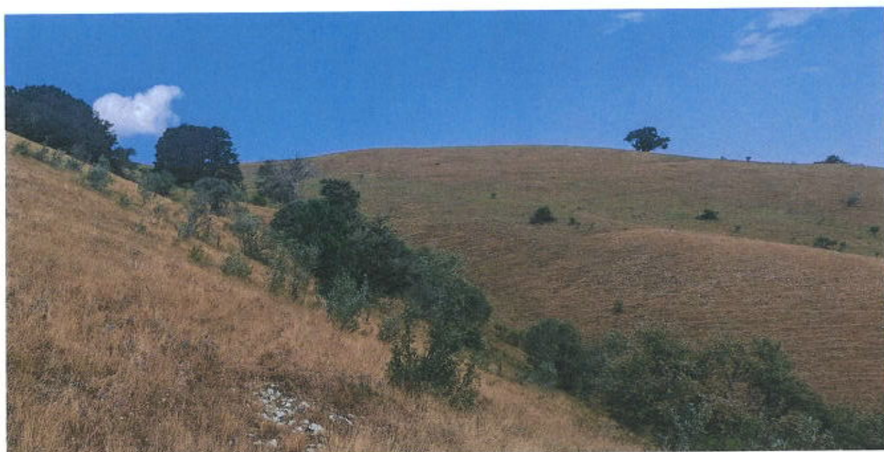
Foto 3 - Monti Coscerno - Civitella - Aspra (sommità) - Loc. Monte Eremita - Ante Intervento