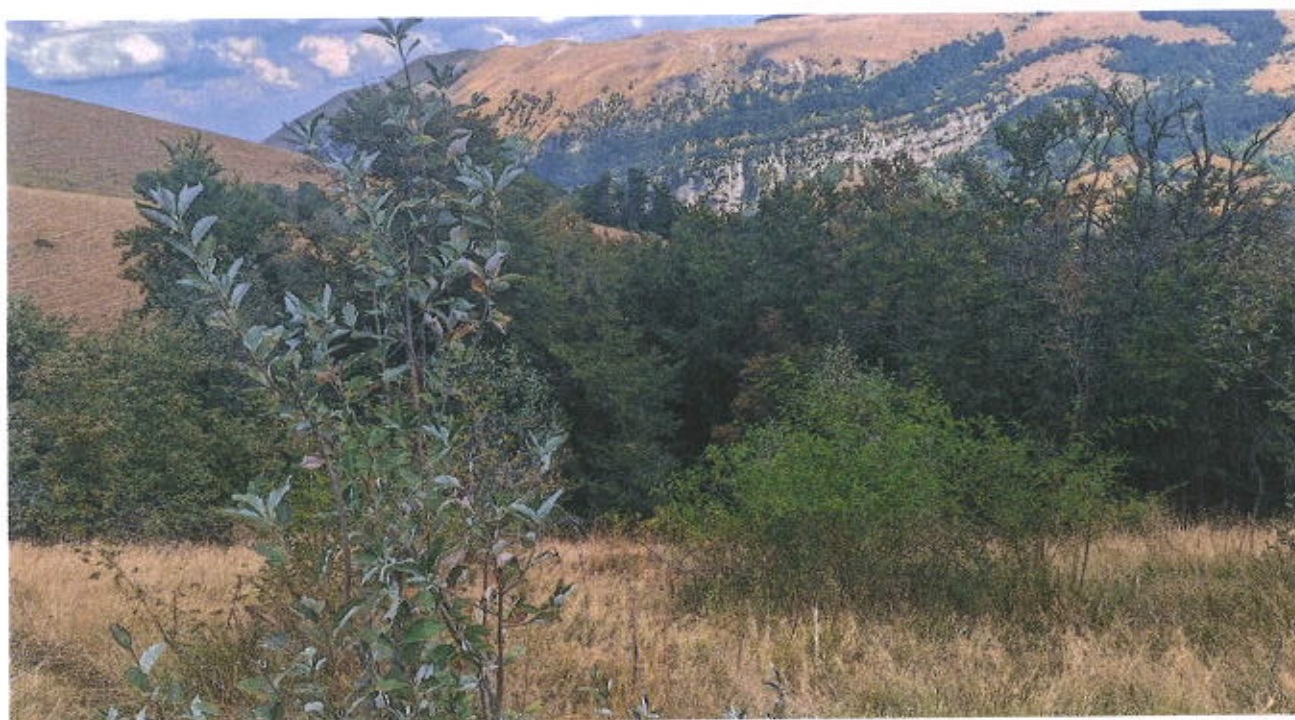
Foto 4 - Monti Coscerno - Civitella - Aspra (sommità) - Loc. Monte Eremita - Ante Intervento