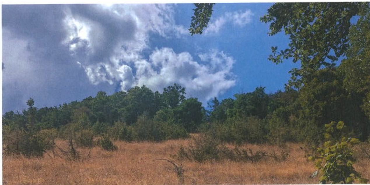
Foto 1 - Monti Coscerno - Civitella - Aspra (sommità) - Loc. Monte Eremita - Ante Intervento